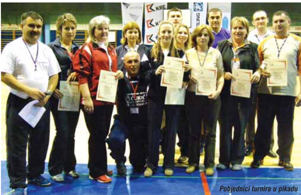
Pobjednici turnira u pikadu

osvojili su debitanti na ovom natjecanju, ekipa Hidrel, a treći je LPG iz Dubrovnika koji je, uz Daumil, pokazao i najveći napredak u odnosu na prošlo izdanje profine Cupa. Osim natjecateljskog dijela, odigrana je i revijalna utakmica Šefovi - Tehničari. Obje ekipe su nastupile u internacionalnoj postavi, igrači su bili iz Austrije, Bosne i Hercegovine, Srbije i Hrvatske.